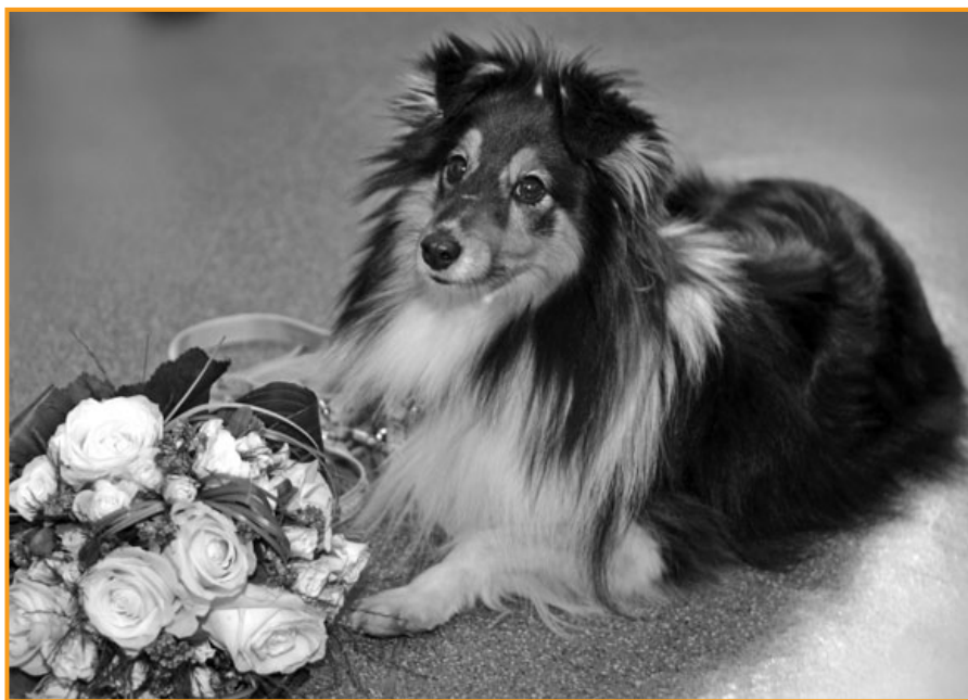
Diesen Blumenstrauß habe ich bewacht

Und wie schnell vergeht die Zeit, gerade geheiratet und geflittert, schon