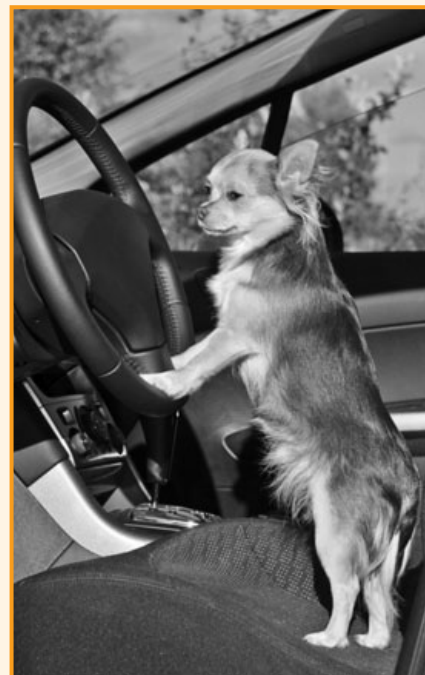
Tiere im Auto leben unter Umständen gefährlich