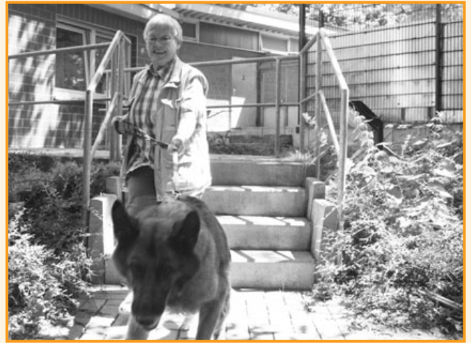
Ehrenamt im Tierschutz