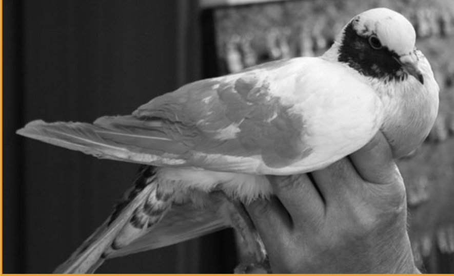
Die Taube findet den Weg zu uns