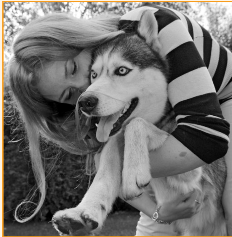
Eine gute soziale Mensch-Hund-Beziehung wie hier ist für Beide von Vorteil

men der Novellierung (Neuerung) des Tierschutzgesetzes plant der Gesetzgeber nun endlich ein sogenanntes „Sodomie-Verbot“. Der Gesetzentwurf sieht Sodomie leider nur als Ordnungswidrigkeit vor, die mit einem Bußgeld von bis zu Euro 25.000,- bestraft werden soll. Auf die Umsetzung des „Sodomie-Ver-