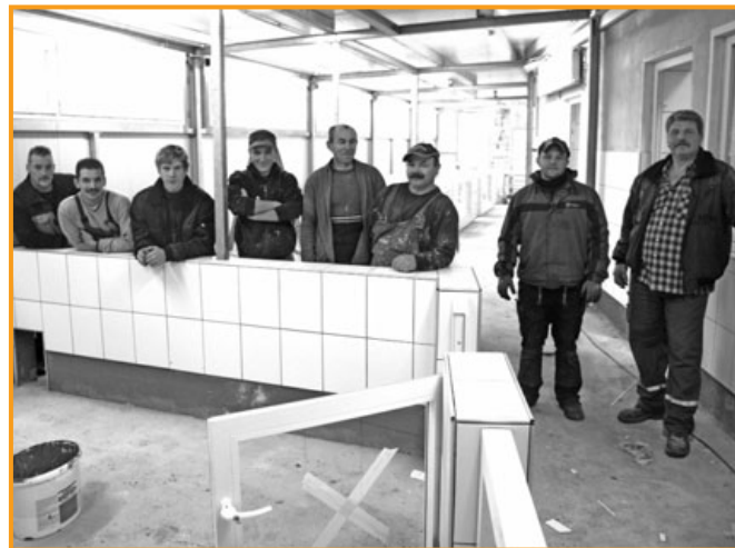
Sanierungen müssen regelmäßig durchgeführt werden