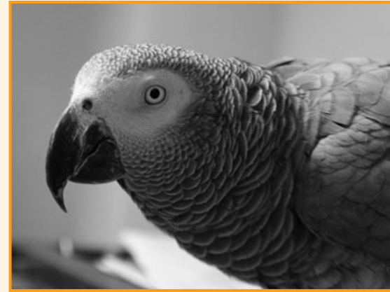
Dröpchen im Büro